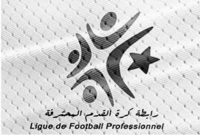
رابطة كرة القدم المحترفة Ligue de Football Professionnel

النتائج السلبية تعصف بثلاثة مدربين وكانت 3 جولات وحسب كافية لبدء مسلسل النتائج السلبية والمشاكل الفنية، فبعد خسارتين متتاليتين، وضع