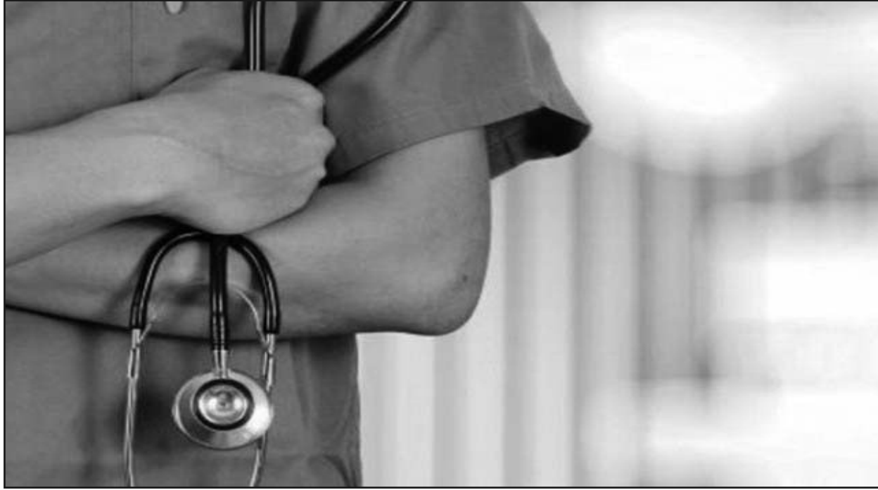
تمريض في الصحة العمومية أسنان بالصحة العمومية بـ 25 والأطفال في الصحة العمومية والمسؤول. ومنصبها وعون رعاية المواليد (25 منصبا)، كما شرح ذات

وسيتم انتقاء المرشحين بناء على معايير تركز على الترتيب في مسابقة على أساس الاختبار في مقاييس ذات صلة مباشرة بمجال التكوين شبه الطبي، كما أشار ذات المصدر.