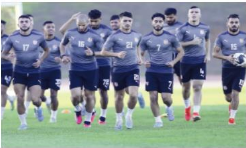
شباب بلوزداد - بورنجرز السير اليوني عشية اليوم بوهران