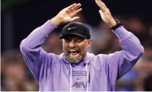
نقاط مباراته رغم تسجيله هذا هدفًا، ولن تحصل صحيحًا في مانشستر يونايتد، لن

أصدرت لجنة الحكام في الدوري الإنجليزي أول قرار ضد حكام مباراة توتنهام وليفربول، بعد إلغاء هدف صحيح لـ"الريدز".