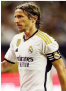
ميامي خلال فترة التحولات الشتوية شهر يناير (كانون الثاني) المقبل. وأكد المتحدث أن مودريتش تلقى

عدة عروض مغرية خلال فترة التحولات الصيفية الماضية، لكنه فضل البقاء في ريال مدريد، يقول، "لقد تلقى (مودريتش) عرضًا من الولايات المتحدة، ومن العديد من الفرق، ولكنه فضل تجديد عقده لوسم إضافي عن عمر يناهز 38 عامًا".