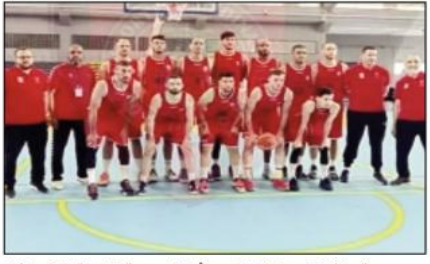
جمعية سلا (المغرب) والفتح (أما المجموعة الرابعة فتمثل كل من الأهلي (مصر) مجد طنجة (العربية السعودية).

فاز نادي اتحاد العاصمة لكرة السلة، عصر الأحد، على "السيب" العماني بطارق مريح (81 - 57) في أول خرجه يمثل الجزائر في بطولة العرب للأندية الـ 35 التي تحتضنها العاصمة القطرية الدوحة. لحساب المجموعة الثانية، وفي لقاء احتضنته قاعة الغرافة، لم يجد بطل الجزائر 2023، صعوبات كبيرة أمام ممثل عمان.