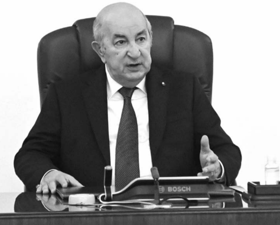
التحويلات في مهنتهم. كما قرر تبون، مساعدة الفلاحين بالجملة من البذور والأسمدة مجانا.

ويأتي هذا خلال ترؤسه اجتماعا لمجلس الوزراء، أين أمر الرئيس تبون بفتح ملف الإمامة وتصنيف الأئمة والمساجد، وحسب بيان رئاسة الجمهورية المتضمن نتائج الاجتماع، فقد أمر الرئيس وزير الداخلية بالتنسيق مع الولاية بتخصيص سكنات وظيفية للأئمة بكل المساجد الكبرى في الولايات، أو من خلال التجمعات السكنية الجديدة، مراعاة لطابع