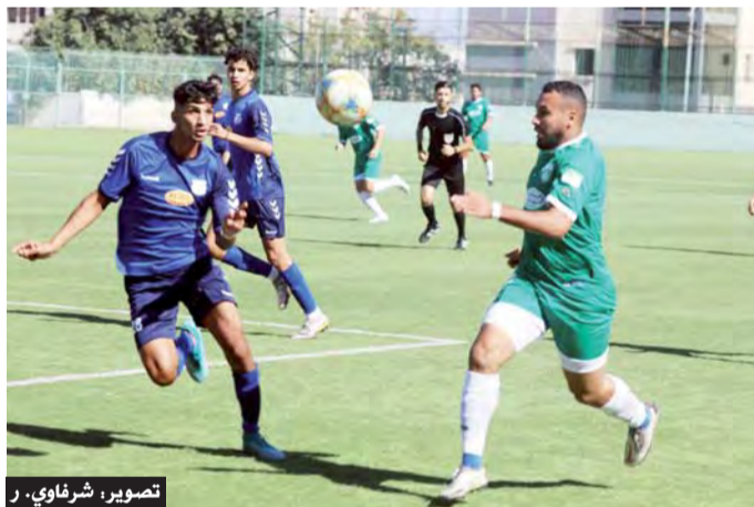
تصوير: شرفاوي. ر

نجم عنه تسجيل الهدف الثاني من تسديدة محكمة عن طريق أمين صناعي على بعد 20 مترا. أما المرحلة الثانية