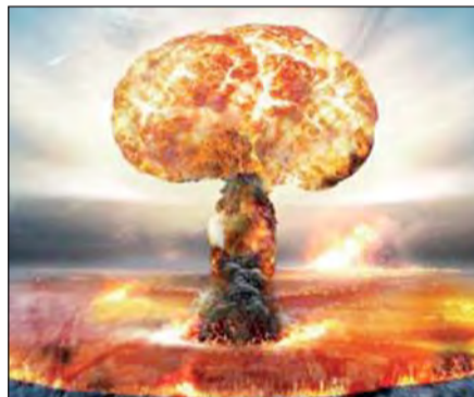
التفجيرات النووية عند القيام بها في الصحراء الجزائرية. هذا وبلغ عدد التفجيرات النووية على المستوى العالمي 2422 تفجيرا منها 543 تفجيرا جوي و 1879 تفجيرا

من جهتها، ناقشت أستاذة العلاقات الدولية، نجوى عابر، «الأسلحة النووية بين مثالية المواثيق الدولية والواقعية الأمنية»، في ظل تزايد الترسانة النووية رغم الغموض الذي يلفها، نظرا لكونها تجارب سرية وجعلها سلاحا للردع وليس للاستعمال.