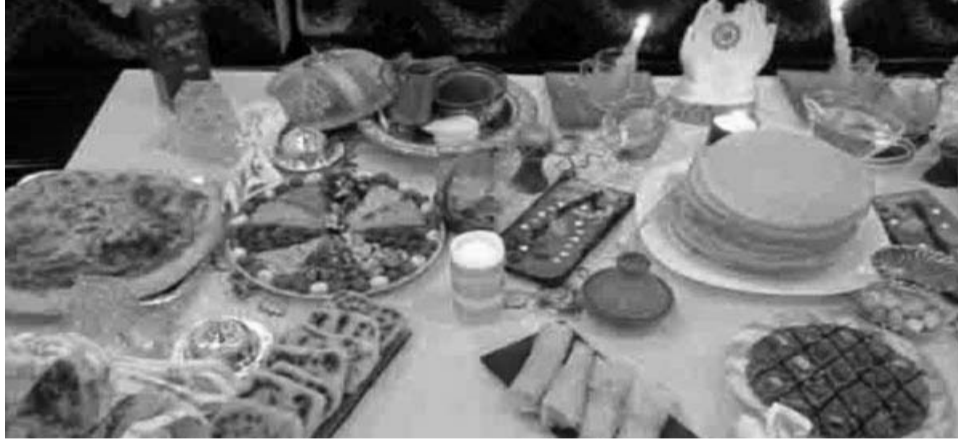
العالم بالرسالة المحمدية"

هذا وتختلف مظاهر الاحتفال بليلة المولد النبوي الشريف من منطقة لأخرى عبر الوطن و يبقى القاسم المشترك بينها استذكار خصال نبي الرحمة وسيرته المعطرة في أجواء روحانية مميزة، إلا أن بعضاً من المظاهر الاحتفالية المغايرة لما تعودت عليه الأسرة الجزائرية بدأت بالانتشار مؤخراً، حيث أصبحت السيدات أكثر اهتماماً بالجانب الجمالي لما يحضره في هذه الليلة وكثيرات هن من يشرعن بالبحث عن كل ما هو جديد ويتلاءم وهذه المناسبة أياماً قبل حلولها. كما لوحظ، ديكورات و اكسسوارات يصنع كثير منها "حسب طلب"، فتأخذ شكل أهلة مزركشة بألوان بيضاء أو ذهبية تحمل اسم الرسول محمد صلى الله عليه وسلم، وأخرى مزينة بعبارة سمولد نبوي شريف"، إلى جانب مجسمات لبيوت الله وأخرى للكعبة المشرفة. هذا وتختلف مظاهر الاحتفال بليلة المولد النبوي الشريف من منطقة لأخرى عبر الوطن و يبقى القاسم المشترك بينها استذكار خصال نبي الرحمة وسيرته المعطرة في أجواء روحانية مميزة، إلا أن بعضاً من المظاهر الاحتفالية المغايرة لما تعودت عليه الأسرة الجزائرية بدأت بالانتشار مؤخراً، حيث أصبحت السيدات أكثر اهتماماً بالجانب الجمالي لما يحضره في هذه الليلة وكثيرات هن من يشرعن بالبحث عن كل ما هو جديد ويتلاءم وهذه المناسبة أياماً قبل حلولها. كما لوحظ، ديكورات و اكسسوارات يصنع كثير منها "حسب طلب"، فتأخذ شكل أهلة مزركشة بألوان بيضاء أو ذهبية تحمل اسم الرسول محمد صلى الله عليه وسلم، وأخرى مزينة بعبارة سمولد نبوي شريف"، إلى جانب مجسمات لبيوت الله وأخرى للكعبة المشرفة. هذا وقد اغتم العديد من الحرفيين على غرار أصحاب محلات الطباعة على مادة الفوركس، فرصة حلول المولد النبوي الشريف للترويج عبر