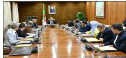
الجلسات. اجتمعت أشغال هذا الاجتماع بدراسة قضايا إدارية، يختم بيان المجلس الشعبي الوطني.

ترأس السيد إبراهيم بوغالي، رئيس المجلس الشعبي الوطني، أول أمس الاثنين اجتماعا لمكتب المجلس، حسب بيان للهيئة التشريعية. وجاء في البيان: «ترأس السيد إبراهيم بوغالي رئيس المجلس الشعبي الوطني، اليوم الاثنين 25 سبتمبر 2023، اجتماعا لمكتب المجلس استعملت الأشغال بدراسة ستة مقترحات قوانين وذلك قبل الانتقال لدراسة طلبين لاستجواب الحكومة». و تابع المكتب أشغاله، بعد ذلك، بالنظر في الأسئلة الشفوية و المكتوبة المودعة لديه و إرسال تلك التي استوفت الشروط المطلوبة إلى الحكومة، ثم بدراسة طلب تقدمت به لجنة الصحة و الشؤون الاجتماعية و العمل و التكوين المهني من أجل تنظيم بعثة استعلامية، يضيف نفس المصدر: «و توصلت الأشغال الاجتماع بدراسة طلب ترخيص بالقيام بنشاطات تطوعية وذلك قبل دراسة مشروع تعليمية عامة تتعلق بتدبير نظام قاعة