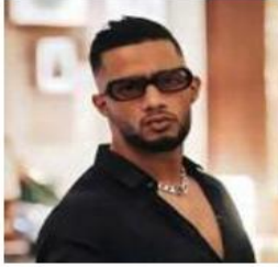
رفض القضاء المصري دعوى تطالب بمنع الفنان محمد رمضان من الغناء والتمثيل، وشطب من نقابة المهن التمثيلية. وفي التفاصيل، قررت

حكمت المحكمة الإدارية على عدم قبول الدعوى المقامة من أحد المحامين ضد «رمضان» لمنع من الغناء والتمثيل. وقال المحامي مقيم الدعوى: «المنع من الغناء، يعكس تقدم الشعوب أو تخلفها، وله دور مهم في المجتمعات، إما أن يفقد المجتمع نحو الرقي، أو يقوده إلى الانحدار والهدم». وأضاف: «المنع موجه وإبداع، وهما الخالق لكل إنسان بدرجات تختلف بين الفرد والأخر، بحيث لا نستطيع أن نصف كل الناس بفئتين إلا الذين يصيرون منهم بالقوة الإبداعية «المهائلة». وجاء في الدعوى: «طريق الفن الهابط الذي ضاع فيه شابنا طوال السنوات الأخيرة لا بد أن تكون نهايته المفترت وتخريب الوجود، وهي أكبر خطيئة يمكن أن ترتكب في حق شعب».