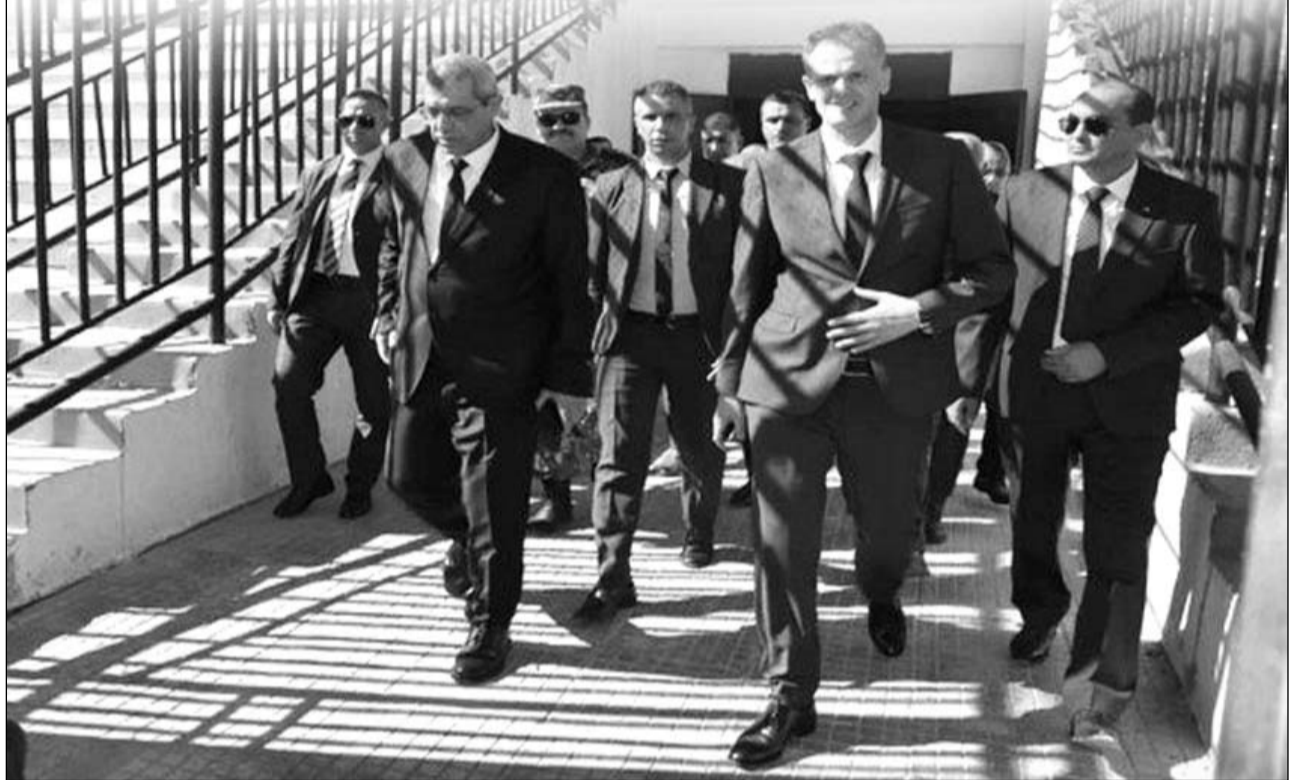
■ سمير ب.

شدد وزير الشباب والرياضة، عبد الرحمان حماد أمس بالمسيلة على ضرورة الاستغلال الأمثل للمنشآت التابعة للقطاع، خاصة ما تعلق منها بالرياضة المدرسية التي تساهم في تطوير وتشجيع المواهب.