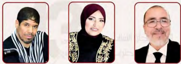
لجنة التحكيم الخاصة بانتقاء عروض المسابقة الرسمية أكتوبر 2023

تواصلت أمس على مستوى المسرح البلدي "محفوظ طواهرى" بمدينة مليانة بولاية عين الدفلى، فعاليات الأيام المسرحية التصفية. حضرها للطبعة الـ 13 للمهرجان الثقافي المحلي للمسرح المحترف المزمع تنظيمها من 19 إلى 24 أكتوبر القادم بولاية سيدي بلعباس. وافترحت المنافسة في يومها الأول بعرض مسرحية "مخ لص" من إنتاج فريق مسرح "نجوم مزغنة" من الجزائر العاصمة، كما تم عرض العمل المسرحي "رسالة مريض" لجمعية الإشعاع للفن الدرامي من مدينة مليانة، إضافة إلى المسرحية الثالثة المبرمجة خلال هذه التصفيات. وفيما يخص انتقاء عروض المسابقة