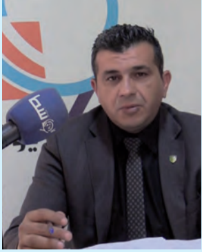
تذليل عراقيل التسيير

وفي سياق متصل، أشار المتحدث إلى تدخل المهام والصلاحيات بين الأطقم الإدارية والتربوية والتسيير المالي عبر العديد من المؤسسات التربوية، الأمر الذي يستدعي بحسبه ضبط مهام كل رتبة بدقة من أجل إزالة كل العراقيل التي تقف أمام التسيير الحسن لمؤسسات التربية والتعليم وهذا ما سينعكس بالإيجاب على السير الحسن لتدريس التلاميذ يضيف المتحدث.