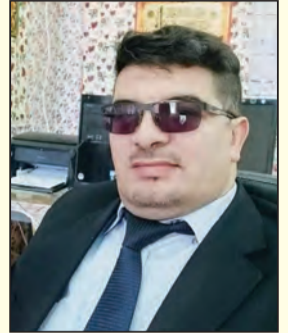
بقلم الأستاذ: عادل قواسمية / جامعة الأمير عبد القادر قسنطينة.

تعرض المجتمع الجزائري في مطلع القرن 19 لغزو فرنسي عسكري، وقد اتخذت فرنسا في شكلها العام الطابع العسكري خاصة الفترة الأولى من الاحتلال، ثم تطور الأمر إلى تنظيم مؤسسات و هيكل تحت إشراف النظام العسكري سعت في مجملها إلى تثبيت وتدعيم ركائز الاستعمار في الجزائر وتأتي في مقدمة هذه الوسائل «التنظيم الإداري»، الذي كان لدى الأولويات التي يستوجب إحداثها في الجزائر، خاصة بعد الصعوبات التي واجهتها الإدارة الفرنسية للسيطرة على الجزائريين، سواء في بداية الاحتلال أو أثناء الثورة التحريرية الكبرى 1954