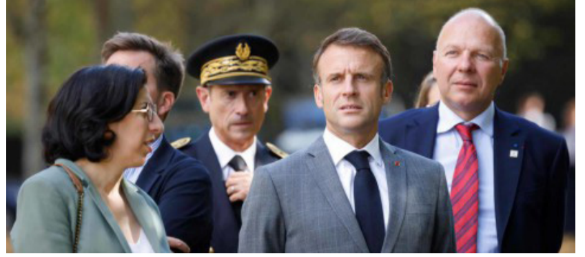
قراءة / محمد علي

أعلن الرئيس الفرنسي إيمانويل ماكرون أن سفير بلاده في النيجر سيعود "في الساعات المقبلة" إلى فرنسا وأن القوات الفرنسية ستغادر هذا البلد بحلول نهاية العام، إثر مواجهة مع المجلس العسكري النيجري استمرت شهرين.