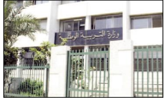
تجاوز الاختلالات المسجلة فيه، وتدخل حيز التطبيق بداية من السنة الدراسية 2023-2024.

ويبلغ الحجم الساعي للسنة الخامسة ابتدائي، 25 ساعة ونصف بـ 7 ساعات ونصف ذات ساعة للغة العربية وثلاث ساعات للغة الأمازيغية وثلاث ساعات ونصف لمادة اللغة الفرنسية وأربع ساعات ونصف لمادتي الرياضيات وساعة ونصف لمواد