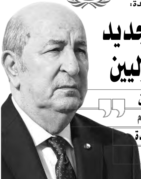
إثر وفاة رئيس إيطاليا السابق جورجيو نابوليتانو

قال الدبلوماسي الصحراوي، لوكالة الأنباء الجزائرية، إنه تابع باهتمام كبير كلمة رئيس الجمهورية السيد عبد المجيد تبون، أمام حضور الدورة 78 للجمعية العامة للأمم المتحدة والتي مثلت تشخيصا وتحليلا شاملا لوضع الدولي الراهن، وما يواجهه العالم من تحديات متعددة الأبعاد. وأضاف سيدي عمار، أن هذه التحديات تضع الهيئات والمؤسسات الدولية على المحك، وتوجب إعادة النظر بعمق في دور الأمم المتحدة، والسعي لمعالجة مشاكل الخلل في النظام الدولي الحالي بروح المسؤولية في سبيل إعلان القيم والمبادئ التي قامت من أجلها الأمم المتحدة. في ذات الإطار، يقول المنسق مع بعثة "الينورسو"، فإن الرئيس تبون، أكد على أن مجلس الجزائر الشقيقتي، من أجل إصلاح النظام الدولي متعدد الأطراف لم يكن وليد اليوم، بل أن الجزائر ناضلت منذ حوالي خمسين سنة من منبر الأمم المتحدة، من أجل إصلاح مكان في النظام الدولي الراهن، مع دعوتها إلى نظام دولي جديد تكون فيه المساواة بين الدول.