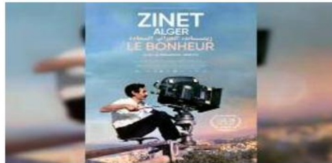
القادر» (2004)، وكذا الفيلم الروائي القصير «شاعة.. إلخ» (2003).

1932-1995) من بين أهم المخرجين في تاريخ السينما الجزائرية ومن صناع مجدها، حيث كانت بداياته مع التمثيل المسرحي قبل أن يشتغل كمساعد مخرج مع إينيو لورنزيني في فيلم «أبدي طليقة» (1964) وجيلو بويكوفو في «معركة الجزائر» (1966). وانتقل بعدها زينات إلى التمثيل حيث عمل كممثل في أفلام عديدة بينها «مونغامي» (1968) و«القسندول» (1970)، وهو من الممثلين القلائل اللذين جسّدوا دور الإنسان «العربي» في الأفلام الفرنسية خلال فترة السبعينات. وسبق للمخرج وكاتب السيناريو محمد لطرف، وهو من مواليد 1923 بسبدي بلعاس، تقديم عدة أعمال سينمائية على غرار الفيلمين الوثائقيين «مجموعة ودار السينما» (2019) و«في البحث عن الأمير عبد