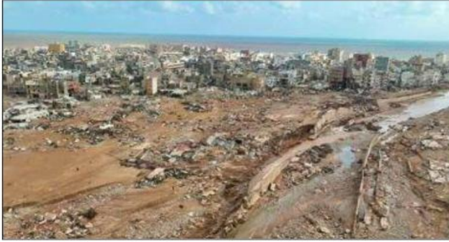
نسى دور الدول الشقيقة والصديقة والمنظمات الدولية الإنسانية والخدمات الطبية والإسعاف، والدعم اللوجستي والأكاديمية المتخصصة بما قدمته في مجال الإغاثة والمساعدات والفرق المتخصصة في احتلال الضحايا.

أعلنت مصلحة الطرق والجسور التابعة لوزارة المواصلات بحكومة الوحدة الوطنية انتهاء فريق اللجنة الفنية للطوارئ من أعمال حصر الأضرار في شبكة الطرق بالمنطقة الشرقية الناتجة عن الفيضانات والسيول المصاحبة للعاصفة «دانيال».