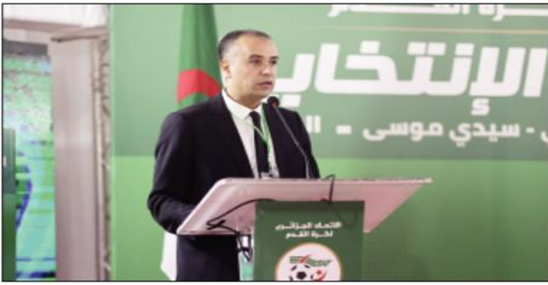
- - عبد الكريم مدوار (رئيس الرابطة الاحترفة)

من المعروف في محيط الكرة الجزائرية أن العلاقة بين عبد الكريم مدوار وصادي ليست جيدة، وقد أكدت العديد من المصادر القريبة من الرئيس الجديد للاف أن مفادته رئيس الرابطة الاحترفة لمنصبة مسألة وقت فقط، على الرغم من أن تنحية مدوار ليست سهلة، بما أنه منتخب وليس معيّنًا. صادي، وفي تصريحاته الأخيرة، أكد عدم رضاه التام عن العمل المنجز من الرئيس السابق لألمبي الشلف، قائلاً، "لست راضياً عن طريقة تسيير رابطة كرة القدم الاحترفة في بداية هذا الموسم.. كان على مسؤولي الرابطة عقد اجتماع تسييري مع مسؤولي الأندية الاحترفة، وللحديث عن المشاكل التي تعاني (الأندية) منها.. زيد بداية موسم هادئة ودون مشاكل".