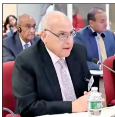
وجمهورية كوريا وسلوفانيا وسيراليون وغويانا، وهي الدول التي انتخبته

وجاء في البيان، "شارك وزير الشؤون الخارجية والجمالية الخارجية السيد أحمد عطاف أمس بنيويورك، في اجتماع وزاري لممثلي الدول الخمس التي ستضم لمجلس الأمن الأممي ابتداء من الفاتح يناير المقبل"، مضيفا أن الأمر "يتعلق بكل من الجزائر