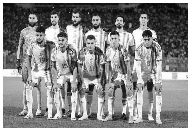
غينيا بيساو، موزمبيق، ناميبيا، وفي سياق متصل تراجع المنتخب الوطني الجزائري، أنغولا، غامبيا وتنزانيا.

مركزا واحدا، في التصنيف الجديد الذي نشره الاتحاد الدولي "الفيفا" أول امس، لحساب شهر سبتمبر الجاري، ليحتل المرتبة 34 عالميا، بعد ان كان في المركز 33 في جويلية الفارط. وعلى الصعيد القاري احتفظ "الخضر" بالمركز الرابع والثالث عربيًا. وعلى صعيد مقدمة الترتيب احتفظت الارجنتين بطلّة العالم 2020 بالمرتبة الاولى متبوعة بفرنسا والبرازيل على التوالي. وسينشر الترتيب المقبل للفيفا يوم 26 أكتوبر 2023.