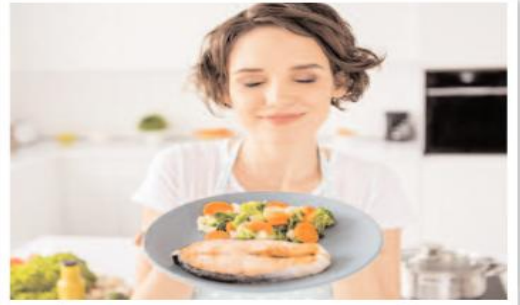
السمك من الأطعمة الغنية بالعديد من العناصر الغذائية الأساسية مثل: أحماض أوميغا 3 الدهنية، وهو مصدر كبير للبروتين، للحفاظ على جسمك نحيقا وعضلاتك قوية.

والمشاكل، ولعلب السمك دوراً بالغا أيضاً في الحفاظ على صحة الكبد والدماع؛ إضافة إلى تحسين جودة النوم. ولكن، هناك بعض الأطعمة التي لا يجب تناولها بعد وجبة السمك؛ منعا للإصابة بسوء الهضم، أو مشاكل القولون المؤلمة، وهي الأطعمة التي تستعمل في اليها في السطور التالية: