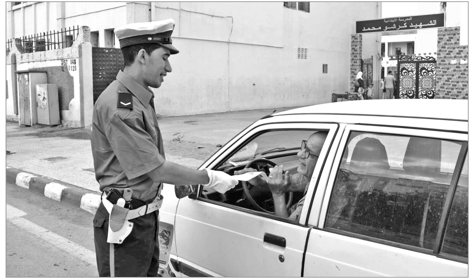
المرخصة التي يملك أصحابها عقود استئجار.

وسطرت مديرية الأمن العمومي بالمديرية العامة للأمن الوطني، مخططاً أمنياً شاملاً تحسباً للدخول المدرسي والاجتماعي، يتم بموجبه إعادة نشر الفرق الأمنية بهدف حماية الأشخاص عموماً والمتدربين بالخصوص، حيث تأخذ التحضيرات لهذا الاستحقاق الاجتماعي حصة الأسد من عمل المديرية العامة للأمن الوطني، التي اتخذت جملة من الإجراءات المتعلقة بالتعبئة الكافية بالتنسيق مع كل المصالح المختصة، وتسخير الوسائل المادية والبشرية التي يتم إدماجها ضمن هذا المخطط وأن مديرية الأمن العمومي تراهن على تكثيف وتكثيف النشاط الميداني تماشياً مع خصوصية الدخول المدرسي، لدمج على النظام العام وتأمين كل المؤسسات