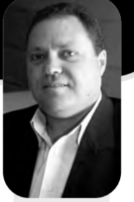
يطلب: سري القدوة

مختلف الفصائل الفلسطينية في كل الفعاليات التي تعم الأراضي الفلسطينية المحتلة ومحيطات اللجوء والشتات والخطوات الأخرى للضغط على حكومة الاحتلال كون أن قضية الأسرى تمثل الضمير الوطني الفلسطيني ولا مساومة أمام حقوق الأسرى في سجون الاحتلال. قضية الأسرى هي قضية الشعب الفلسطيني وهم بمثابة النبراس الوطني الذي يسترشد منه شعبنا عبر مسيرته النضالية ويجب على الجميع مساندتهم وهم يخوضون المعركة وعدم تركهم وحدهم يواجهون الاحتلال الجرم واعتبار مسؤوليته ذلك تقع على عاتق كل الفصائل الفلسطينية دون استثناء احد وضرورة أن تدرج الفصائل والأطر والجمعيات والمؤسسات خطورة اللحظة واتخاذ القرار في مواجهة حكومة الاحتلال وما تريد فرضه على الأسرى وعلى الشعب الفلسطيني. اجتماع الدولي ومجلس الأمن والمنظمات الحقوقية الدولية وخاصة الصليب الأحمر الدولي مطالبين بضرورة التدخل العاجل لوقف هذه القرارات والتراجع عنها والعمل على حماية الأسرى من كل هذه الإجراءات والقرارات العنصرية المحمقة بحقهم وفقا لقرارات الشرعية الدولية واتفاقية جنيف الخاصة بالأسرى ومساندتهم حتى نيل حريتهم وحقوقهم المشروعة.