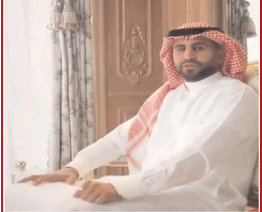
قائد المنتخب الوطني لكرة القدم رياض محرز يظهر بالزيّ الخليجي بمناسبة تصوير إعلان تجاري في السعودية..