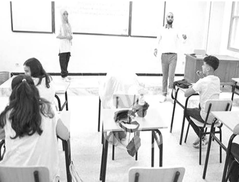
الوطنية يعد لأغيا وعديم الأثر

أعلن وزير التربية الوطنية عبد الحكيم بلعابد أمس الثلاثاء بالبيضاء عن استعادة أزيد من 3، 5 مليون تلميذ من أبناء العائلات المعوزة ومحدودة الدخل من المنحة المدرسية التضامنية برسم الموسم الدراسي الجديد 2023-2024.