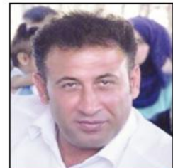
يقلم: سامي إبراهيم هودة

المتعسرين في قلاع الأسر أعزائي القراء أحياتي الأفاضل فما أنا بصدد اليوم هو تسليط الضوء على رجال أشداء صابرين على الشدائد والبلاء. رسموا بأوجاعهم ومعاناتهم والأهم طريق الجهد والحرية واقفين وقوف أشجار الزيتون، شامخين سموخ جبال فلسطين صابرين صبر سيدنا أيوب في سجنهم فهم غيبتهم غيابهم سجون الاحتلال الصهيوني وظلمة الزنازين عن عيوننا. هل نغيب أرواحهم الطاهرة التي تسكن أرواحنا فهم حاضرون بأفئدتنا وإصرارنا وعقولنا وفي مجرى الدم في عروقنا مهما طال الزمن أم قصر عندما نستحضر صور هؤلاء الأبطال البواسل جنرات الصبر والصمود ونستذكر أسمائهم المنقوشة في قلوبنا والراسخة في عقولنا ووجداننا لا نستطيع إلا أن نقف إجلالاً وإكباراً لهؤلاء الأبطال الذين ضحوا بأجمل سنين عمرهم ليعيش أفراد شعبيهم كباقي شعوب الأرض في عزة وحرية وكرامة. فسرنا تاج الضغار وفخر الأمة هم من قهروا الاحتلال الصهيوني بصمودهم وبناباتهم وأمام عظمة تضحياتهم لا