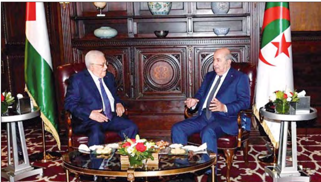
استقبل رئيس الجمهورية السيد عبد المجيد تبون صباح أول أمس بنيويورك (الولايات المتحدة الأمريكية)، نظيره الفلسطيني السيد محمود عباس .

وقد جرى هذا اللقاء الذي تم بمقر إقامة الرئيس عبد المجيد تبون عشية انطلاق الدورة الـ 78 للجمعية العامة للأمم المتحدة. وحضر هذا اللقاء عن الجانب الجزائري وزير الشؤون الخارجية والجمالية الوطنية بالخارج أحمد عطاف والمندوب الدائم للجزائر لدى الأمم المتحدة السيد عمار بن جامع أما عن الجانب الفلسطيني فقد حضر كل من وزير الخارجية والمغتربين رياض المالكي والمندوب الدائم لدولة فلسطين لدى الأمم المتحدة رياض منصور .