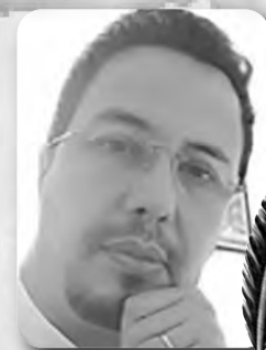
بقلم : حسان زهار