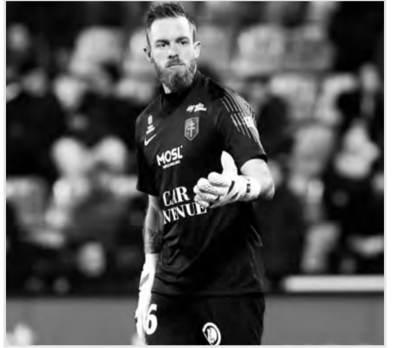
الكبير، مثلما كان الحال، أمام لانس ضمن الجولة الخامسة، بعد أن تمكن من الحفاظ عن نظافة شبكه

وتشير معلومات إلى أن جمال بلماضي سيعمل على إقناع ألكسندر أوكيدجة على العودة للخضر، وهذا بسبب قدرته على تقديم الإضافة لتشكيلة الخضر، على غرار تصفيات كأس العالم 2026 ونهائيات أم أفريقيا 2023 المقررة مطلع العام المقبل في كوت ديفوار. جدير بالذكر، أن أوكيدجة ورغم فترته الطويلة نسبياً مع منتخب الجزائر من 2018 إلى 2023، لم يشارك إلا في عدد محدود من المباريات الدولية (6 فقط)، بسبب وجود الحارس وهاب رايس مسوخي الحارس الأساسي له (لحاربي الصحراء) من 2010 إلى 2022.