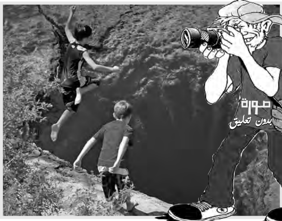
صورة بدون تعليق

تقدمت زوجة بطلب الطلاق، بعد دقائق قليلة من عقد قرانها، فيما يُعتقد أنه أقصر ارتباط زوجي في التاريخ، وقد تم الطلاق بعد أن سخر العريس من العروس أثناء مغادرتها حفل الزفاف، عقب انتهاء الإجراءات القانونية فأثناء خروج الزوجين من قاعة المحكمة، تعثرت العروس وسقطت، ودافع العريس إلى وصفها بالفجيعة. غضبت العروس بشدة من سخريه زوجها، وطلبت من القاضي إنهاء زواجهما على الفور وبالفعل وافق القاضي، وأصدر قسيمة فسخ الزواج بعد 3 دقائق فقط من عقده القران. الزوجان، اللذان يعيشان في الكويت، لم يغادرا قاعة المحكمة أبدا زوجا وزوجة، وقد وصف زواجهما بأقصر زواج في تاريخ البلاد.