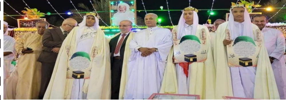
حفل زواج جماعي لـ 41 عريسا، وتكريم 20 خاتما للقرآن الكريم، في متيللي بولاية غرداية