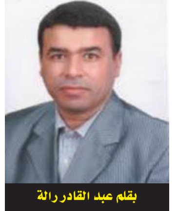
بقلم عبد القادر رالة

على غير عادته ! نهضت واحتضنته ، ثم أجلسته بجاني وسألته: - ما بك ؟ ... يا صغيري ... نظر إلي ثم تنهد قائلاً: - زارنا اليوم رجل من رجال الحماية المدنية وتكلم طويلاً... قال هذا العام اللعب بالمفرقات ممنوع في ليلة الاحتفال بالمولد النبوي الشريف ! نحن لسنا مثلكم أتم الكبار!... ابتسمت وقلت: - أعتقد أنه لم يقل ممنوع الاحتفال لكن طلب منكم الحذر! - نحن الأطفال لسنا مثلكم يا أمي... تعودنا أن نفرح بمولد سيدنا محمد عليه