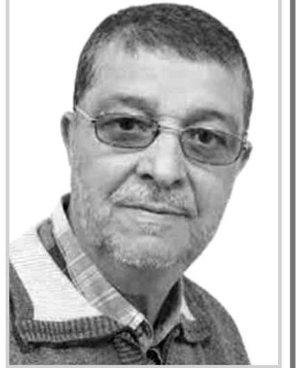
بقلم قرار المسعود

أعطى ثماره و أدى مهمته و كانت مهمته مقبولة على العموم لأن في المجال السياسي كل ما يخطط يكون غير ثابت مئة بالمئة قد يكون أعلى من ذلك أو أقل و هذا راجع لعوامل تخرج في بعض الأحيان عن السيطرة لأن التخطيط موجه لأمة و ليس مجموعة معينة و تنفيذ هذا البرنامج في حد ذاته له مدة و مرتبط و متعرض لتغيرات مستمرة و غير معلنة. أما ما اعتقده بالنسبة للخريف الإفريقي الذي نعيشه اليوم في الساحل و دول الجوار الجنوبي له ، يختلف عن سابقه من عدة عوامل، فمن جانب الزمان جاء في وقت الاتصالات المتعددة الأشكال و التقنيات بين الأفراد و المجتمعات و جانب التعليم و الإطلاع و التفتح و من جانب التركيبة البشرية بجيل جديد حماسي. فهل البرنامج أعد من تلقاء نفسه و أضيف له بعض الرتوشات أو كشف المدسوس هو الذي زاد الطين بلة من خلال استطلاع المواطن يومياً على ما يحاك له، أم جاء وعد ربك بعد أن تجاوز حدوده ؟ و من