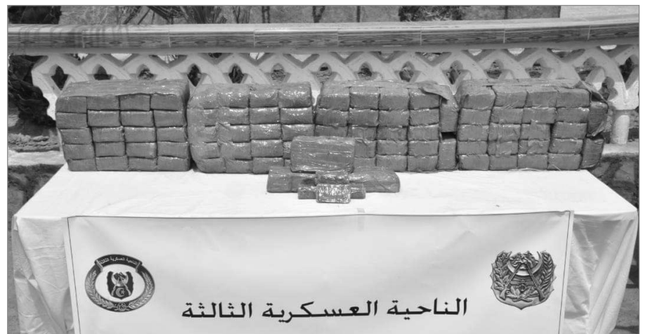
الناحية العسكرية الثالثة

من جهة أخرى، أحبط حراس السواحل "محااولات هجرة غير شرعية بسواحلنا الوطنية و أنقذوا (77) شخصا كانوا على متن قوارب تقليدية الصنع" فيما تم "توقيف (87) مهاجرا غير شرعي من جنسيات مختلفة عبر التراب الوطني".