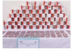
مخدرات، مؤثرات عقلية وخمور

مسكنه العائلي وحجز 04 صناديق مخدرات بوزن 397 غرام بالإضافة إلى 210 كسبولة بريقالين 300 ملغ مع مبلغ 66000 دج من عائدات الترويج. كما تم توقيف شخصين آخرين بكل من حمام أكتيف وطريق عين الطويلة ببلغان من العمر 31 و 35 سنة أحدهم مسبون قضائيا باستغلال مسكن ومركبة سياحية لنقل وتخزين المشروبات الكحولية بغرض بيعها بدون رخصة حيث تم حجز 6545 وحدة من مختلف الأنوع والأحجام بالإضافة إلى مبلغ تقدر ب 16200 دج من عائدات البيع بعد استكمال كافة الاجراءات القانونية اللازمة تم تقديم المشتبه بهم أمام الجهات القضائية ب إقليم الاختصاص.