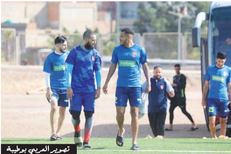
تصوير العربي بوطيبة

المهاجمين الجيدين تجدهم مطلوبين بقوة من مختلف الفرق المحترفة والهاوية، لذا نجد صعوبات ناهيك عن ذلك فإن قلة الأموال قد تعيق نجاح أي فريق في عملية الاستعدادات الأموال هي التي تتحكم في سوق التحويلات الصيفية لذا تجد الفرق التي لديها سيولة مالية تحسم الصفقات الجيدة مبكراً ويبقى فقط في السوق لاعبون عاديون لأن فريقنا لا يعتمد عليهم وهذا من غير التقليل من قيمتهم لأن بطولة الدرجة الثانية هواة تحتاج إلى أصحاب الخبرة والتجربة .