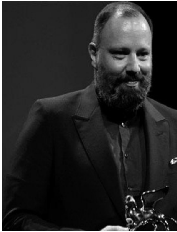
بيتر سارسغارد بجائزة مصاب بالخرف) في فيلم أفضل ممثل عن دوره (أرمل "ذاكرة" (Memory) كما فاز الممثل الأميركي

وانطلقت الدورة الـ 80 للمهرجان في 30 أغسطس/آب الماضي، واختتمت السبت بعد دورة غابت عنها الأفلام والنجوم الأميركيون بسبب إضراب كتّاب وممثلين هوليوود، ومنعهم من الترويج لأفلامهم في المهرجانات، وهو ما انعكس على نتائج المسابقات. ذهبت جائزة أفضل ممثلة إلى الأميركية كايلي سباني عن عملها في فيلم "بريسيليا" للمخرجة الأميركية أيضا صوفيا كوبولا، وهو عبارة عن قراءة في علاقة بريسيلا بريسلي المبكرة مع زوجها المطرب الأسطوري إليفيس بريسلي. كما فاز الممثل الأميركي