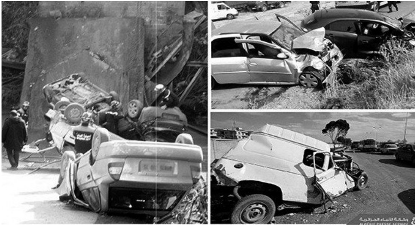
شخص في حالة خطر والقيام بـ 4020 عملية اسعاف، يضيف المصدر ذاته

وخلال نفس الفترة، قامت وحدات الحماية المدنية بـ 2118 تدخلا سمحت بإخماد 1498 حريق منها منزلية صناعية، أهمها سجلت بولاية الجزائر، البلدة وسكيدة. وبالإضافة الى ذلك، نفذت وحدات الحماية المدنية، ما لا يقل عن 4638 تدخل من أجل انقاذ 325