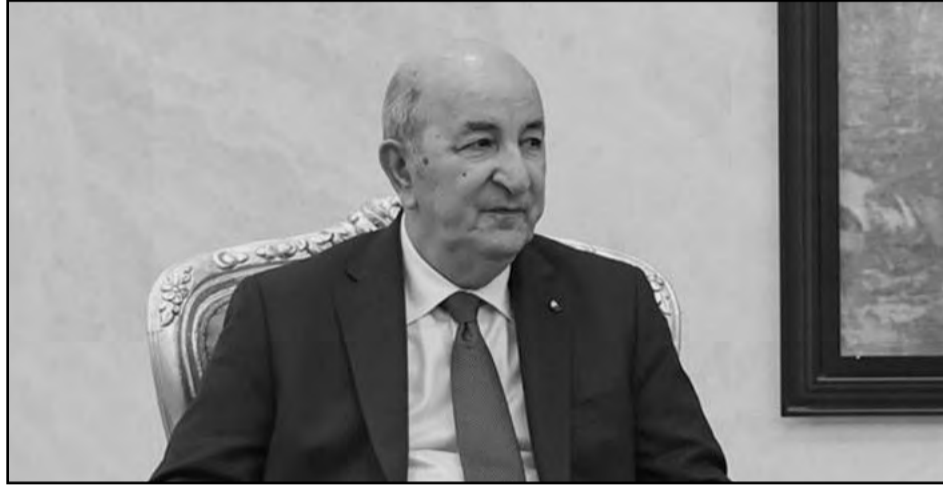
عطاف يجري مكالمة مع رئيس المجلس الرئاسي الليبي

قررت الجزائر، بتوجيهات من رئيس الجمهورية، السيد عبد المجيد تبون، إرسال مساعدات إنسانية هامة واستعجالية إلى ليبيا الشقيقة، وذلك إثر الإعصار الذي ضرب عددا من المدن الليبية، حسب ما أفاد به، الثلاثاء، بيان لرئاسة الجمهورية.