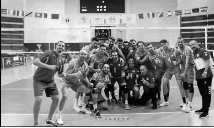
يحفزنا". للتذكير جرت النسخة الأخيرة لبطولة المنتخب التونسي أمام الكاميرون 3-1. إفريقيا للأمم (رجال) عام 2021 برواندا وتوج بلقبها ع.ب

ضمن المنتخب الوطني الجزائري للكرة الطائرة (رجال)، مشاركته في البطولة العالمية، بعد تأهله إلى الدور النهائي للبطولة الإفريقية.