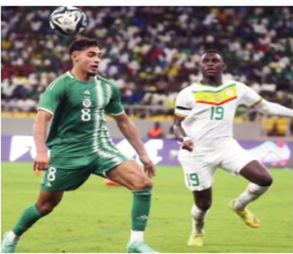
المدافع وعرفت كيف تعبر العشر دقائق الأولى ، ومحاولة اللعب

على الهجمات المعاكسة بالاعتماد على محرز وبن رحمة على الأجنحة وبونجاح كراس حرية ، الى غاية الدقيقة 64 حيث تمكن شابيبي من هز شباك الحارس السنغالي ماندي براسية محكمة بعد استقبال كرة من محرز على اثر تنفيذ مخالفة من الجهة اليمنى ، بعد هذا الهدف حاول السنغاليون العودة في التحدي ، من خلال محاولة لعب ورقة الهجوم ، وتوريعة الكرات نحو ساديو ماني لكن قوة المدافع يوسف عطال حالت دون ذلك ، كما لعب الحارس مانديورا دورا كبيرا في الحفاظ على شبكته نظفيا الى غاية نهاية المباراة بتفوق الخضر بنتيجة هدف دون . وتعد هذه المباراة الثالثة التي يخوض فيها المنتخب الوطني على نظيره السنغالي منذ 2019 .