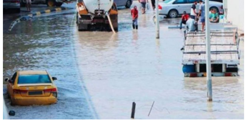
قراءة / محمد علي

غمرت مياه الأمطار أحياء عدة في العاصمة طرابلس، في حين تشهد مدن الشرق الليبي حالة طوارئ جراء العاصفة دانيال التي ضربت البلاد قادمة من البحر المتوسط بعد مرورها باليونان.