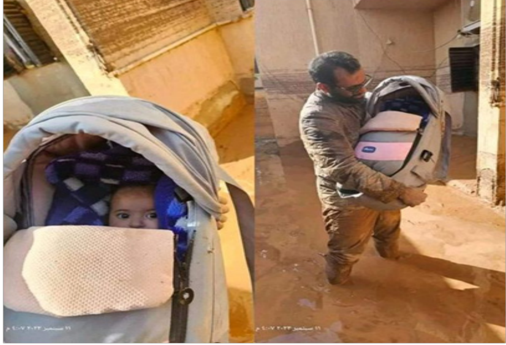
طفل ليبي كل عائلته جرفتها السيول وهو بقي على قيد الحياة تم العثور عليه من قبل فريق الإنقاذ