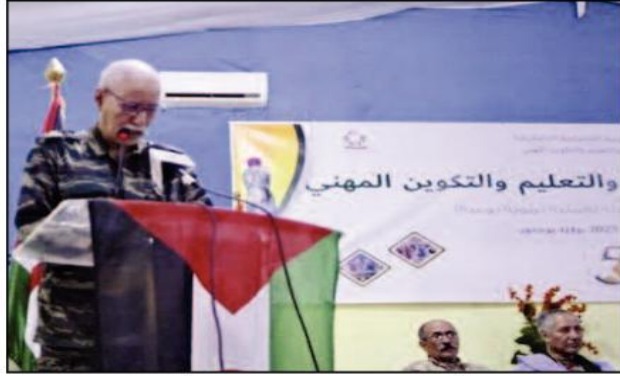
المبعوث الشخصي الأممي، ستيفان دي ميستورا، للولايات المتحدة وللأراضي المحتلة. ودعا بالتمسكية، مجلس الأمن الدولي إلى «التحرك الفوري لوقف هذه الانتهاكات الجسيمة لحقوق الإنسان، وتكثيف «المنورسو» من تنفيذ مأموريتها التي كلفها بها بموجب خطة التنموية

للتقدم ولا للمساومة في تقرير المصير والاستقلال». في ختام أشغال الندوة الوطنية للتربية والتعليم والتكوين المهني، أكد السيد غالي على أنه «وفي ظرف وجيز، تحولت مخيمات اللاجئين الصحراويين والأراضي المحررة إلى نموذج متميز في كامل المنطقة، وتحقق تطور سريع ومضطرد في مجالات عديدة، في مقدمتها التعليم والتربية، في ظل واقع وظروف استثنائية». ولم يقتصر الأمر - يضيف الرئيس غالي - على الأطفال الذين سرعان ما تحولوا إلى تلاميذ وطلبة ثم إلى آلاف الإطارات والكفاءات من خريجين من المعاهد والجامعات، في شتى الاختصاصات، بل شمل كل فئات المجتمع، ما جسده حملات نحو الأمية والتثقيف الشعبي».