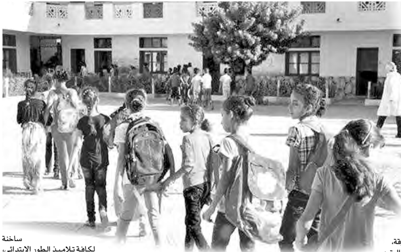
ساخته لكافة تلاميذ الطور الابتدائي، خصوصا التلاميذ القادمين من مختلف القرى والمدشر المحيطة ببلدية مغنية.