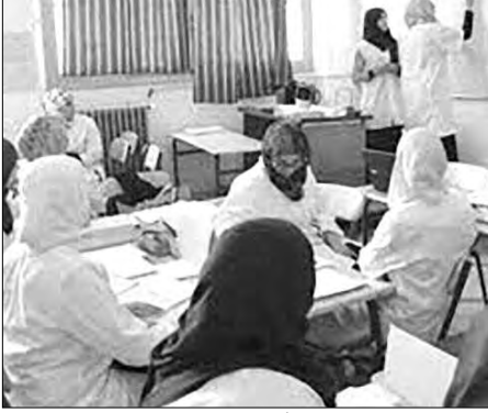
المؤسسات التعليمية بالطور الأول، وقد بلغ عددها 602 مدرسة. ابتداءً عبر تراب ولاية وهران. رضوان ق.

و حسب مديرية التربية للولاية، فإن عملية إدماج أساتذة اللغة الإنجليزية، جاءت تكتملة لعملية التوظيف بالطور الأول، بعد أن تم إدراج تلاميذ السنة الرابعة ضمن المستفيدين من قرار تدريس اللغة الإنجليزية، الذي أصبح يخص تلاميذ سنتي الثالثة والرابعة ابتدائي، ضمن مساعي الوزارة لتعميم استخدام اللغة الإنجليزية بكل الأطوار التعليمية. وقصد توفير الشروط البيداغوجية اللازمة، شرعت مصالح مديرية التربية لولاية وهران، في عمليات تكوين ورسكلة وتوفير شروط عمل الأساتذة، خاصة في مجال سادة التربية البدنية، حيث وضعت لعا تجهيزات وإمكانيات خاصة على مستوى