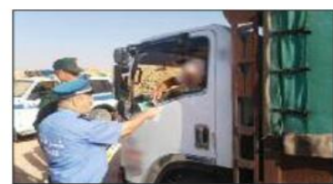
أحمت مصالح الأمن العمومي وأمن ولاية الأغواط خلال شهر جرح 21 شخص من مختلف

مع تسجيل حالي وفاة. ويهدف الوقاية من حوادث المرور ككثف ذات المصالح من حملاتها التحسيسية والتوعوية للوقاية من حوادث المرور من خلال توعية وتحميس مستعملي الطريق العام، سيما سائقي مختلف المركبات والدراجات النارية، وكذا فئة الراجلين بضرورة الالتزام والتقييد بقواعد السلامة المرورية، التي تضمن سلامتهم وسلامة غيرهم، حفاظا على أمن وسلامة مستعملي الطريق العام.