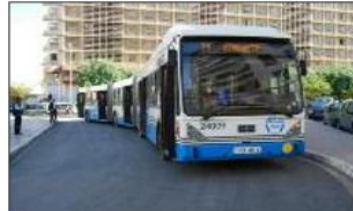
يدخل حيز التطبيق ابتداء من العمومية بخصوص الخدمة من «أس» وأوضحت المؤسسة الصباحية أنها تنطلق من الساعة

05 سـ 40 د صباحا وتدرج إلى غاية الساعة 19 سـ 30 مساء لتغطية 129 خط بواسطة 334 حافلة، بمعدل توقيت للرحلات يقدر بـ 30 دقيقة بين كل رحلة. وذكر «إيتوزا» بشأن الخدمة الليلية أنها تنطلق من الساعة 18 سـ 50 وتدرج إلى غاية الساعة 00 سـ 50 بتغطية 19 خط بواسطة 19 حافلة. أما فيما يتعلق ببرنامج عطلة نهاية الأسبوع، خصصت حافلة «إيتوزا» يوم الجمعة 138 حافلة لتغطية 129 خط، ويوم السبت