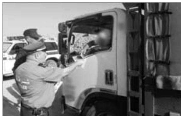
والدرجات النارية، وكذا فعة والراجلين بضرورة الإلتزام و التقيد بقواعد السلامة المرورية، التي تضمن سلامتهم و سلامة غيرهم، كما تم