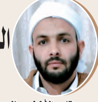
بقلم: الأخضر عالب ص 8

العوامل المساعدة لتقوية جهاز المناعة الايمانية