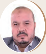
بقلم: يحيى ناعوس ص 9

العوامل المساعدة لتقوية جهاز المناعة الايمانية