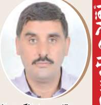
بقلم: عبد الكريم العراجي ص 9

أهمية الوكالة الوطنية للتعاون الدولي والتضامن