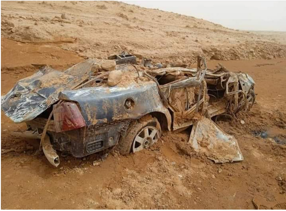
هذه سيارة الضحايا الذين جرفتهم السيول بالبيض