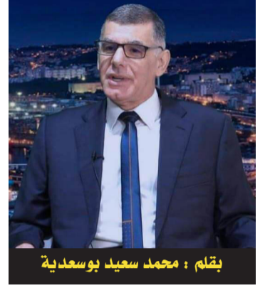
يقلم : محمد سعيد بوسعيدية

لم نبحت كثيراً عن الدوافع النفسية وكذا المعرفية التي دفعت بأركون للتلميذ الذي تحصل على البكالوريا سنة 1949 من الالتحاق بقسم اللغة العربية وآدابها. لقد اختار دراسة لغة الشرق وآدابه وفكره وفلسفته إلى درجة العشق، لكن على يد المستشرقين الغربيين، ولم يكن راضياً عن مناهجهم كما صرح مرارا ذلك؛ وتجراً في رسالة التخرج إلى دراسة ونقد أعمال طه حسين (أنظر مقالنا بعنوان قراءة في كتاب محمد أركون: "الجانب الإصلاحي في أعمال طه حسين)، بل تجرأ في نقد الموروث بصفة عامة، وكانت فاتحة لمشروعه في نقد العقل الإسلامي. كان أمل أركون وهو طالب بالسوربون أن يبقى مشرقياً-جزائرياً في اختيار موضوع أطروحته للدكتوراه ولكن بأدوات ومنهجيات غربية؛ لقد وقع اختياره على "الإسلام الإثنولوجي- السوسولوجي المعيش في منطقة القبائل" تحت إشراف المستشرق الكبير "جاك بيرك". صحيح أن الموضوع كان من اقتراح لويس ماسينيون، لكن الأمر الذي شجعه في هذا الاختيار هو ذكريات الطفولة التي قضاه مع عالم الإثنولوجيا "جان سيرفقيه" الذي اختاره وهو ابن الرابعة عشرة في سنه، من أجل مساعدته على فهم بعض المعطيات عن بيئته وقرينته التي كانت موضوع أطروحة دكتوراه لهذا العالم. كان هذا الأخير يلقي أسئلة عديدة ومتباينة عن قرية "توريرت ميمون"؛ أسئلة بدت غريبة على أركون في البداية، إلا أنه اكتشف من بعد أهمية النظرة الإثنولوجية والتميز الذي تقيمه بين الثقافة الشفهية، وهي ثقافة قرينته المحسدة في تنظيم "تجمعت" الذي كان يمثل عائلته فيه، والثقافة العالمة المكتوبة