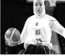
وجمهورية الكونغو الديمقراطية. فروجة ن.

البرنامج الكامل للمنافسة الإثنين 4 سبتمبر القرب (سيدات) غانا - أونغندا (رجال) الثلاثاء 5 سبتمبر الجزائر - زامبيا (سيدات) الجزائر - أونغندا (رجال) جنوب إفريقيا - كونغو الديمقراطية (سيدات) جنوب إفريقيا - إفريقيا الوسطى (رجال) كينيا - نيجيريا (سيدات) كينيا - السنغال (رجال) الأربعاء 6 سبتمبر كونغو الديمقراطية - المغرب (سيدات) نيجيريا - إفريقيا الوسطى (رجال) نيجيريا - زامبيا (سيدات) كونغو الديمقراطية - المغرب (رجال) غانا - جنوب إفريقيا (سيدات) غانا - الجزائر (رجال) الخميس 7 سبتمبر القرب - أنغولا (رجال) جنوب إفريقيا - المغرب (سيدات) نيجيريا - جنوب إفريقيا (رجال) كينيا - الجزائر (سيدات) مصر - كينيا (رجال) الجمعة 8 سبتمبر كينيا - زامبيا (سيدات) السنغال - مصر (رجال) الجزائر - نيجيريا (سيدات) أنغولا - كونغو الديمقراطية (رجال) كونغو الديمقراطية - غانا (سيدات)