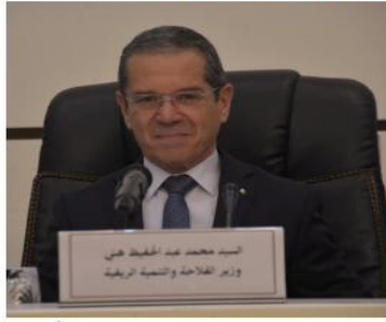
السيد محمد هنى وزير الزراعة والتنمية الريفية

مع توزيع الإعانة الخاصة بالتوسيع الفلاحي الحالي، مجددا التأكيد على أن الدولة واقفة إلى جانب المزارعين، وبالنسبة للإنتاج الفلاحي للمواد الواسعة الاستهلاك على غرار الخضروات والفواكه واللحوم الحمراء والبيض، فقد أكد السيد هنى أنه سيتم اتخاذ إجراءات صارمة في أقرب وقت لتوفير مختلف المسود وضمان الاستقرار في الأسعار. في السهوب والجنوب سنطلق فيه خلال السنة الجارية، مبرزا أهمية البرامج الوطني لحماية المربين لاسيما من ناحية توزيع الأعلاف المدعمة، وكذا برنامج توسيع إنتاج التمور اللذين يجري العمل عليهما، وبخصوص تعويض المزارعين للتضررين من الجفاف وشح الأقطار أو الفيضانات فقد قال الوزير هنى أنه سيتم الانطلاق في التعويضات العينية كشف أمس وزير الزراعة والتنمية الريفية السيد محمد عبد الحفيظ هنى في تصريح له على هامش افتتاح الدورة البرلمانية العادية 2023/2024 بمجلس الأمة أنه يجري الإعداد للإطلاق ثلاثة برامج وطنية تهدف لتوسيع إنتاج التمور والزيتون وحماية المربين، مضيفا أن البرنامج الوطني لتوسيع المساحات المزروعة بأشجار الزيتون لاسيما