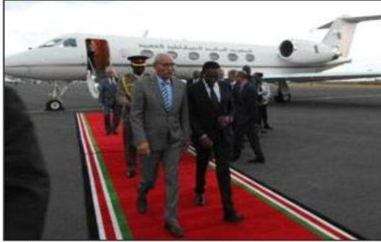
مشاريع العمل المناخي. وتهدف قمة إفريقيا للمناخ إلى تجميع الأحداث الرئيسية وتقديم موقف قاري مشترك في المؤتمر الـ28 للأطراف

حل الرئيس الصحراوي، الأمين العام لجبهة البوليساريو إبراهيم غالي، أول أمس بالعاصمة الكينية نيروبي للمشاركة في قمة إفريقيا للمناخ التي انطلقت أمس الاثنين، وذلك بعد دعوة رسمية من الرئيس الكيني ويليام روتو، رئيس لجنة رؤساء الدول والحكومات الإفريقية المعنية بتغير المناخ.