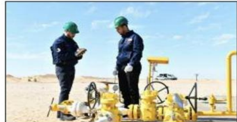
أعلن مجمع سوناطراك في بيان له عن إيداع 471 عرض عمل على مستوى الفرع الولائي التابع للوكالة الوطنية للتشغيل بولاية إليزي وهذا من أجل سد حاجيات منشآتها الإنتاجية

بالولاية. وجاء في البيان، «تعلن سوناطراك عن إيداع عروض عمل على مستوى الفرع الولائي التابع للوكالة الوطنية للتشغيل باليزي عبر المنصة الرقمية OGC الخاصة بالوكالة الوطنية للتشغيل». ويشمل إجمالي هذه العروض «471 منصب. منها 437 منصب عمل جديد، بالإضافة إلى جدولته 34 منصب آخر شاغر متبقى من حصة التوظيف السابقة المنظمة بذات الولاية في الفترة الممتدة من 27 أبريل إلى 1 ماي 2023، لعدم استيفاء المترشحين لشروط التوظيف». يضيف ذات المصدر. ويأتي هذا العرض، حسب سوناطراك، «ضمن تنفيذ مخطط التوظيف لسنة 2023، من أجل سد حاجيات المؤسسة على مستوى منشآتها الإنتاجية بولاية إليزي».