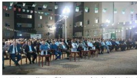
الصفيفة الشبابية المتخصصة التي تقام تحت شعار «معاً» تشبيك الجهود من أجل مواطنة فاعلة»، مسرعاً لتتشبيك الجهود من أجل مواطنة فاعلة».

أشرف رئيس المجلس الأعلى للشباب، مصطفى حيدوي، مساء الأحد بتنس (ولاية الشلف)، على افتتاح فعاليات الدورة الثانية من المخيمات الصيفية الشبابية المتخصصة، والتي تشمل فئة الطلبة المتخرطين في النوادي الجامعية من مختلف ولايات الوطن.