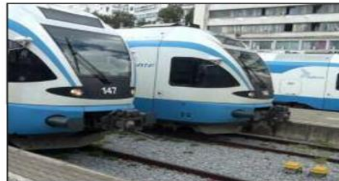
فرقها اقتصية تعمل منذ الساعات الأولى لإصلاح هذا الخلل واستئناف السير العادي للقطارات في أقرب ممكن.

أعلنت الشركة الوطنية للنقل بالسكك الحديدية أمس عن توقف حركة قطارات الضاحية الغربية للجزائر العاصمة ما بين بئر توتة والعفرون بالبلدية، ذهابا وإيابا بسبب انقطاع التيار الكهربائي وأوضح ذات المؤسسة في بيان لها أن المصالح اقتصية للشركة الوطنية للنقل بالسكك الحديدية، سجلت صباح اليوم الإثنين، انقطاع للزود بالطاقة الكهربائية على مستوى الخط الرابط ما بين محطتي بئر توتة والعفرون، إثر اشغال تيران بالأشجار المحيطة بالسككة الحديدية ما بين محطتي بئر توتة وبوفريك على مستوى النقطة الكيلومترية (29 PK + 004) مما أدى إلى سقوط شجرة وانقطاع التيار الكهربائي. وتسيبت هذه الوضعية، يضيف المصدر، في توقف حركة قطارات الضاحية الغربية للعاصمة ما بين بئر توتة