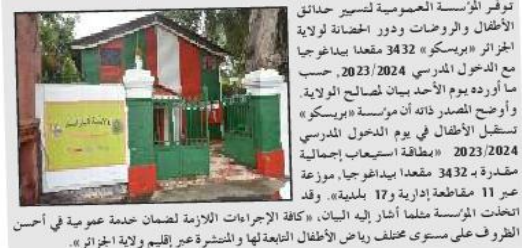
توفر المؤسسة العمومية لتسيير حدائق الأطفال والروضات ودور الحضنة لولاية الجزائر «بريسكو» 3432 مقعدا بيداغوجيا مع الدخول المدرسي 2023/2024، حسب ما أوردته يوم الأحد بيان لمصالح الولاية. وأوضح المصدر ذاته أن مؤسسة «بريسكو» تستقبل الأطفال في يوم الدخول المدرسي 2023/2024 بمقاعة استيعاب إجمالية مقادرة بـ 3432 مقعدا بيداغوجيا، موزعة عبر 11 مقاطعة إدارية و17 بلدية. وقد اتخذت المؤسسة مطلقا أشار إليه البيان، «كافة الإجراءات اللازمة لضمان خدمة عمومية في أحسن الظروف على مستوى مختلف رياض الأطفال التابعة لها والمنشرة عبر إقليم ولاية الجزائر».