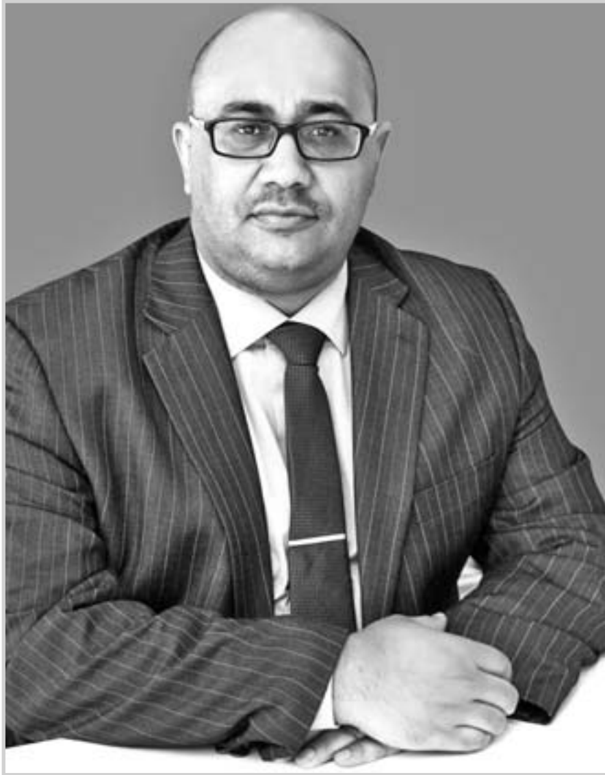
بقلم : د. محمود عبد العال فراج

في الحقيقة لم أجد تفسيراً لظاهرة الهجرة الشرعية إلا بصرف مثال سراب الظمان فهي ظاهرة مخفية مرعبة، يكفي النظر إليها من بعيد لمعرفة مدى خطورتها وما حجم التهلكة التي يتعرض لها هؤلاء المهاجرين في سبيل الوصول إلى بلد آخر يحسبونه ملاذاً آمناً ولكن هيئات هيئات، قد يكون هذا الرأي مخالف لقناعات الكثيرين ممن اكتسبوا بالحروب أو تعرضوا للاضطهاد والظلم ويقولون كيف لك أن تحكم على امر لم تألفه، والحقيقة أنا اتفق معهم، فانا أو من وبكامل قناعاتي الشخصية ألا أحكم وأقرر عن الآخرين، فقررت أن أسبر غور هذه المسألة الشائكة التي تنامي تيارها في السنوات الأخيرة لعلني أكون محظناً في حكمي المسبق، فلهما بنا نتعرف على هذه الظاهرة بكل أبعادها الاجتماعية والاقتصادية ونجلي عنها أسبابها ونكشف عن نتائجها، والامر مطروح لكم للحكم على ما سيرد في متن هذا المقال، الذي أحاول الخوض فيه واستشعر ما يعانیه الجميع سواء كان المهاجرين أنفسهم أو أسرهم أو مجتمعاتهم الحالية أو المستقبلية، والامر منوجه نظري يحتمل وجود أكثر من وجهة نظر، فدعونا نرمي بالحجر الذي لا أظنه الأول في هذا المجال وإنما قد يكون الكثير قد سبقني في التعرض إليه.