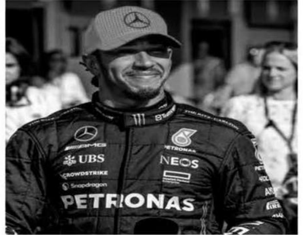
واقفت إدارة فريق مرسيدس المنافس في بطولات العالم بسباقات فورمولا 1 على تجديد عقد النجم البريطاني المحظرم لويس هاميلتون حتى عام 2025، بعد عدة أشهر من المفاوضات الصعبة بين الطرفين. وبحسب صحيفة "ديلي ميل" البريطانية

الجمعة، فإن النجم المحظرم لويس هاميلتون (38 عاماً) سيحصل على 50 مليون جنيه إسترليني سنوياً لمدة عامين مع فريق مرسيدس، ما يجعله السائق الأعلى أجراً في فورمولا 1. وتابعت أن لويس هاميلتون حصل في النهاية على ما يزيد من فريق مرسيدس، بعدما رفع قيمة ما يحصل عليه سنوياً 10 ملايين جنيه إسترليني جعلته يفي مع الفريق، الذي سيبلغ معه في نهاية عقده الأربعين من عمره. وأوضحت أن لويس هاميلتون وضع نصب أعينه الآن، بعد حسم مسألة تجديد عقده، العودة مرة أخرى إلى منصة التتويج، والظفر بلقبه العالمي الثامن، ولديه الفرصة في عامي 2024 و2025 من أجل تحقيق الرقم القياسي في فورمولا 1. وأردت بالقول أن البريطاني لويس هاميلتون أصبح الرياضي الأكثر جنياً للأموال في فورمولا 1، خاصة أن منافسه الهولندي ماكس فيرستابن، سائق فريق ريد بول، يحصل على ما يقرب من خمسين مليون جنيه إسترليني أيضاً. كما اختلفت بأن موافقة إدارة فريق مرسيدس على رفع القيمة المالية في الراتب السنوي للنجم البريطاني المحظرم لويس هاميلتون، هدفاً أساسياً إعطائه الحافز الإضافي والرغبة حتى يعود إلى منصة بطولة العالم في فورمولا 1 مرة أخرى.