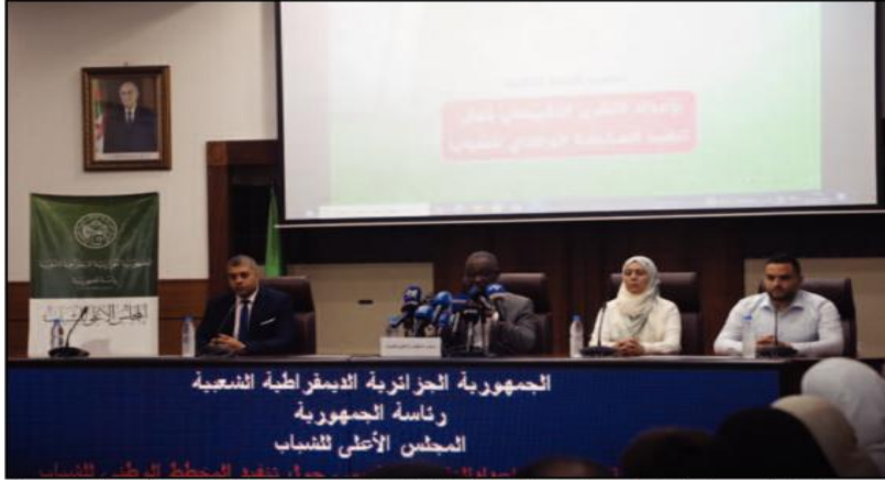
الجمهورية الجزائرية الديمقراطية الشعبية رئاسة الجمهورية المجلس الأعلى للشباب

أشرف، أمس السبت، رئيس المجلس الأعلى للشباب، مصطفى جيدوي، رفقة نوابه بالمركز العائلي للصندوق الوطني للتأمينات الاجتماعية للعمال الأجانب بالجزائر العاصمة، على تنصيب اللجنة الخاصة بإعداد التقرير التقييمي حول تنفيذ المخطط الوطني للشباب.