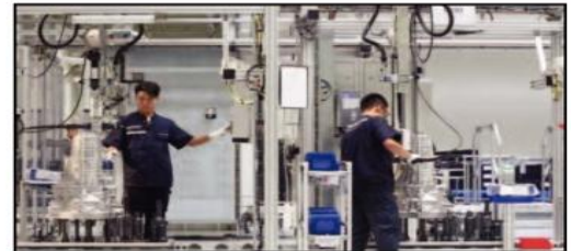
«تراجعت صادرات كوريا الجنوبية للشهر 11 على التوالي في أوت،

وانخفضت صادرات البلاد إلى دول رابطة دول جنوب شرق آسيا (آسيان) بنسبة 11 في المائة على