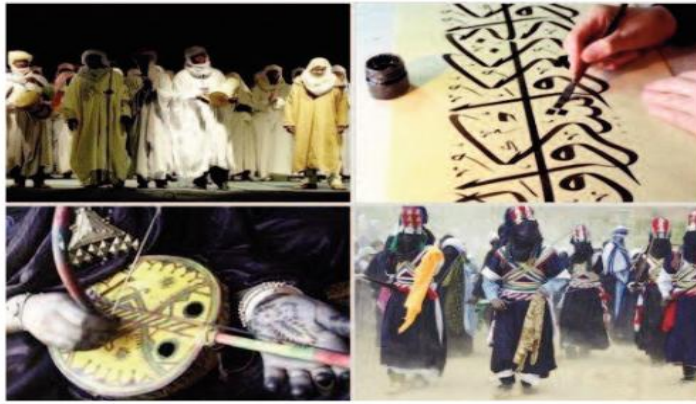
وقال حاشي في هذا السياق إن العناصر البحث والعمل الذي قاده باحثون التي تم تصنيفها هي نتيجة سنوات من ومتخصصون في المجال على غرار عمل

وكانت الجزائر قد أودعت ملفا لإدراج ملف بعنوان «الزبي النسوي الاحتفالي للشرق الجزائري الكبير: «معارف ومهارات متعلقة بخياطة وصناعة حلي التزين: الفندورة والملحفة» في القائمة التمثيلية للتراث الثقافي غير المادي للبشرية. وقد تم تحضير هذا الملف منذ ماي 2022، حيث تم تجنيد كل من مديريات الثقافة والفنون، مؤسسات ثقافية ومتحفية تحت وصاية وزارة الثقافة والفنون، باحثين جامعيين، أهل الفن، حرفيات وحرفيين، ورشاش الخياطة والصياغة التقليدية وجمعيات المجتمع المدني بالتنسيق مع المركز الوطني للبحوث في عصور ما قبل التاريخ علم الإنسان والتاريخ، من أجل السماح للجزائر أن تكون في الموعد السنوي المحدد من طرف منظمة «اليونسكو» في 31 مارس من كل سنة.