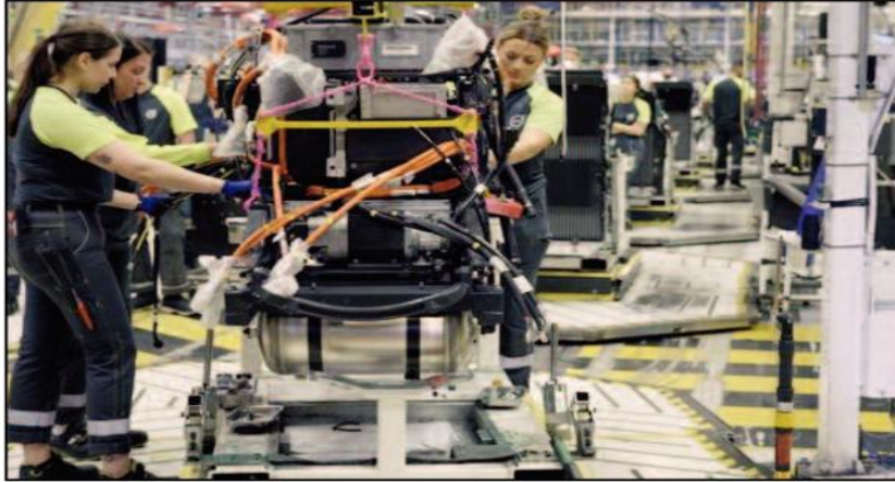
مستواه الحالي 3.75 في المائة.

واستقرت فائدة التمويل العقاري في ألمانيا دون تغيير، في حين ارتفعت في فرنسا بمقدار 12 نقطة أساس إلى 3.16 في المائة. وتراجعت فائدة التمويل العقاري في إيطاليا بمقدار نقطة أساس إلى 4.23 في المائة وارتفعت في إسبانيا بمقدار نقطتي أساس إلى 3.77 في المائة وهو أعلى مستوى لها منذ مارس 2009. كما ارتفعت في هولندا بمقدار ثلاث نقاط أساس إلى 3.89 في المائة وهي الأعلى منذ أبريل 2013.