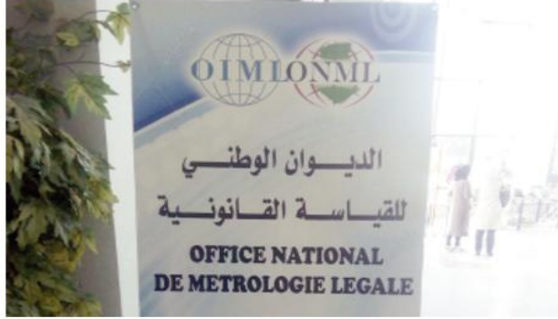
.. الجزائر في المراتب الأولى عالميا من حيث عدد الأجهزة المراقبة سنويا

كما أشار إلى الشروع في تشكيل شبكة من المخابر سيتم تعيينها كمخابر وطنية "مرجعية" في إطار البرنامج التطويري للنظام الوطني للقياس.