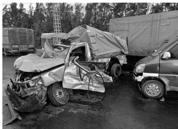
إلى العنصر البشري بنسبة تفوق 96 بالمائة، نتيجة عدم احترام قانون المرور، عدم التقيد بمسافة الأمان، الإفراط

وفي هذا الإطار يضيف البيان، تجدد المديرية العامة للأمن الوطني دعوتها لمستعملي الطريق العام إلى احترام قانون المرور، وتوخي الحيطة والحذر أثناء السياقة، كما توضع تحت تصرف المواطنين الرقم الأخضر 1548 وخط النجدة 17، لتلقي البلاغات على مدار 24 ساعة.