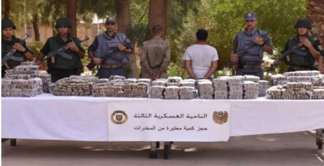
الناحية العسكرية الثالثة حجز كمية معضرة من المخدرات

تمكنت وحدات ومفارز للجيش الوطني الشعبي، من إحباط محاولات إدخال 8 قناطر و 9 كيلوغرام من الكيف للعلاج عبر الحدود مع المغرب، فيما تم ضبط (336075) قرص مهلوس، خلال الفترة الممتدة من 23 إلى 29 أوت 2023.