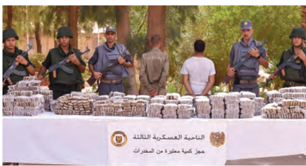
الناحية العسكرية الثالثة حجز كمية معتبرة من المخدرات

تمكنت وحدات ومقارن الجيش الوطني الشعبي، خلال الأسبوع الأخير، من كشف وتدمير مخبأ يحتوي على 20 قذيفة مضادة للدبابات و12 قنبلة يدوية تقليدية الصنع، بالإضافة إلى كمية من الذخيرة والمتفجرات وأغراض أخرى، فيما تم القبض على عنصرين دعم للجماعات الإرهابية وتوقيف 31 تاجر مخدرات، مع إحباط محاولات إدخال أزيد من 8 قناطير من الكيف المتاح عبر الحدود مع المغرب.