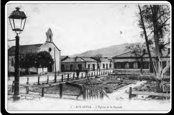
9 - AIN-SEFRA - L'Eglise et la Square