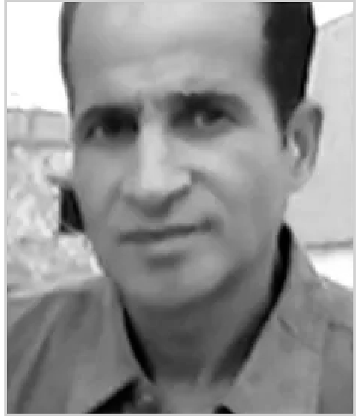
بقلم: جمال نصرالله

عندنا أو في إفريقيا والعالم الثالث عموما، دون نسيان الأفلام الآسيوية، التي هي دوما في المراتب الدنيا. وعليه نستنتج أنه لطالما توفرت الامكانيات لكثير من المخرجين بحكم العلاقات والفرص التي يحوزونها دون غيرهم (مع التسليم أن النصوص الأصلية والسيناريوهات يكونان في المستوى) لكن الكاميرا التي هي طبعًا تترجم حركية عقل المخرج، تقع في سقطات صيبانية وأكثر من تافهة، وكأنها موجهة للعقول اللاواعية، وهي كذلك حتما، حين تجدهم وما أكثرهم يُعجبون بهذا العمل أيما إعجاب، ونحن نقصد الجمهور المستهلك. وذلك نظير محدودية أفهامهم وتقبلهم لكل الأفكار والطروحات، وبالاختصار المفيد لا يهمهم من هذا الفيلم أو ذاك سوى بعض المتطلبات الغرائزية للقطات الإثارة الجنسية، أو العنف واستخدام السلاح. وعالم الأكشن. وحين نعود إلى تحليل أفكار المخرجين أتذكر هنا مقولة زميلي الذي شاطرته الرأي يومها، عن أن كثير من المخرجين مستوهم الثقافي محدود ومجزأ، وهذا على الرغم من تكوينهم السينمائي وحياتهم على شهادات من كبريات المعاهد الدولية، ورغم ذلك يبقى ذلك فقط على المستوى التقني وليس الفكري والتبصري التوسعي!؟ لأن المخرج الكبير هو من يحرص على استحضار جميع اللوازم والمتطلبات المادية والمعنوية