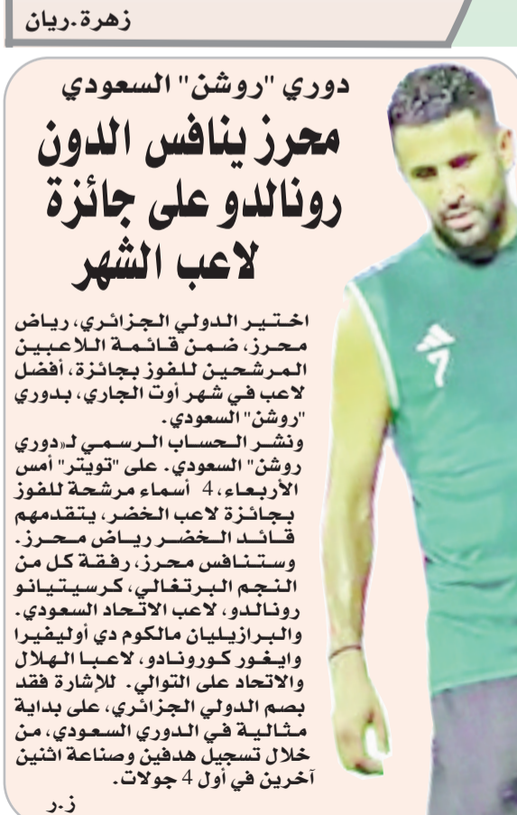
دوري "روشن" السعودي محرز ينافس الدون رونالدو على جائزة لاعب الشهر